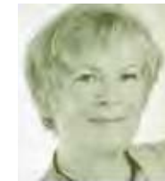
Ruth von Braunschweig