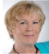
Ruth von Braunschweig